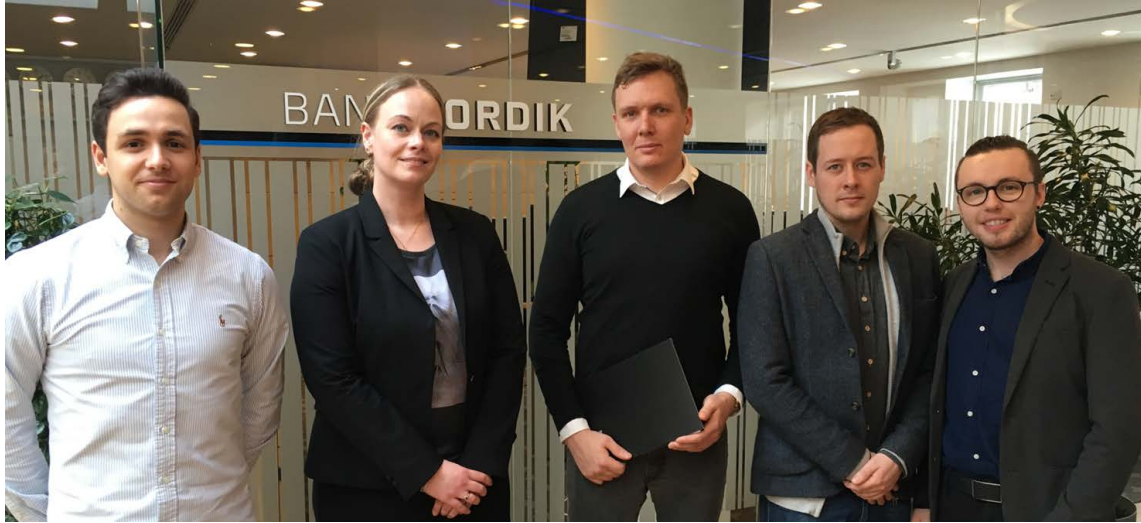
BankNordik og Samvinnan, ið er áhugafelagið fyri føroysk lesandi á Copenhagen Business School, gjørdu eina tvey-ára samstarvsavtalu í 2017. Avtalan styrkir grundarlagið hjá Samvinnuni og er við til at menna stevnumiðið hjá felagnum at virka fyri at knýta tey lesandi tættari at føroyska vinnulívinum.