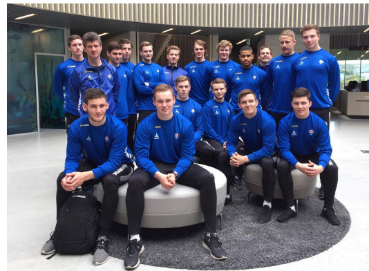
BankNordik er errin høvuðsstuðul hjá føroyska U21 hondbóltslandsliðnum, sum spældi seg víðari úr bólkaspælinum í HM-endaspælinum í Algeria í juli 2017. Myndin er frá eini vitjan í BankNordik, áðrenn liðið legði leiðina móti Algeria.