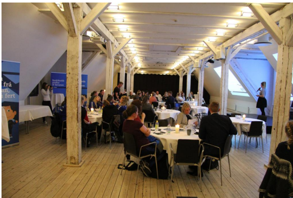
Í september 2017 var BankNordik vertur fyri einum útisetakvöldi í Keypmannahavn. Á skránni var kunning til lesandi útisetar frá Føroyahúsinum, Ráðgevingini, BankNordik og Samvinnuni.